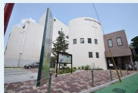
大名クロスガーデン

「主にあって、教会と共に、教会に仕える神学校」、「働きながら学び、働きながら伝道者養成」を目指す夜間の神学校として1988年秋に設立。すべてのコース（専攻科・本科・聴講）で通信可。日本バプテスト連盟の諸教会・伝道所に遣わされている現役の教役者は100名を超えている。